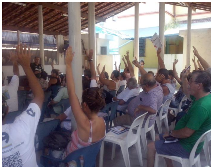
Assembleia no Sinpro Santos, dia 08 de fevereiro de 2014

Com o cenário de inflação instável, a luta por ganho real de salário será ainda mais valiosa. O engajamento dos professores na campanha poderá fazer toda diferença, ajudando a pressionar os donos de escola durante as negociações.